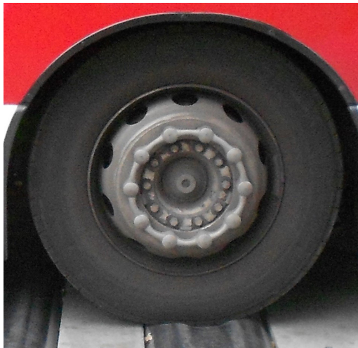
Buss: IFD trycks ned och bussen guppar inte.