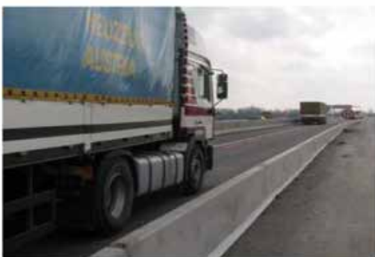
Skydd av en arbetsplats – kapacitetsklass H1

Man kan montera 2 000 m DB 65S med 3 anställda och en kranförare/truckförare på en dag (8 tim).