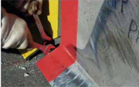
Fästbultarna dras åt

Spännbultarna måste dras åt. Det löpande sträckstaget och åtsittande kopplingarna garanterar att DELTABLOC®-skyddssystemet fungerar på rätt sätt.