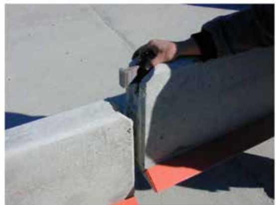
Elementet sänks ned och sätts ihop med den patenterade kopplingen

När elementen placeras ut förs den patenterade kopplingen in i stålkärnan. Närmast basen kan elementen riktas in mot varandra med hjälp av en stålstång. Innan elementet sätts ned helt är det viktigt att sträcka elementkedjan något.