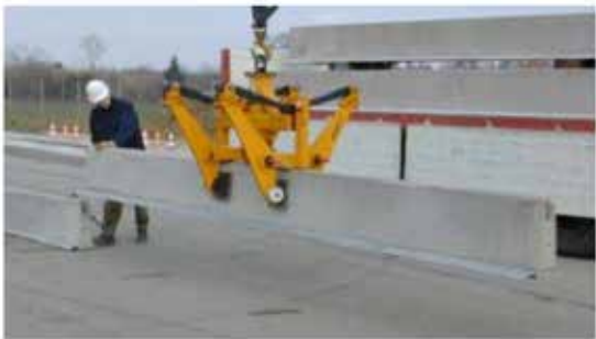
Montering med gripare för skyddsbarriärer

För hantering av DELTABLOC®-elementen används en gripare för skyddsbarriärer av betong tillsammans med en kran eller gaffeltruck.