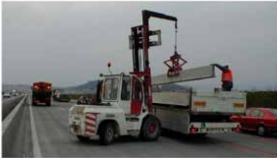
Lossning med gaffeltruck

Elementen levereras vanligtvis till arbetsplatsen med lämpliga lastfordon. En gaffeltruck eller kran kan användas för att lossa barriärerna.