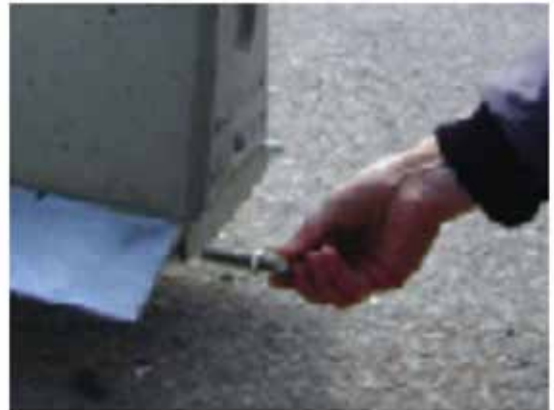
Bultarna förs in vid lossningen

När elementen placeras ut förs den patenterade kopplingen in i stålkärnan. Närmast basen kan elementen riktas in mot varandra med hjälp av en stålstång. Innan elementet sätts ned helt är det viktigt att sträcka elementkedjan något.