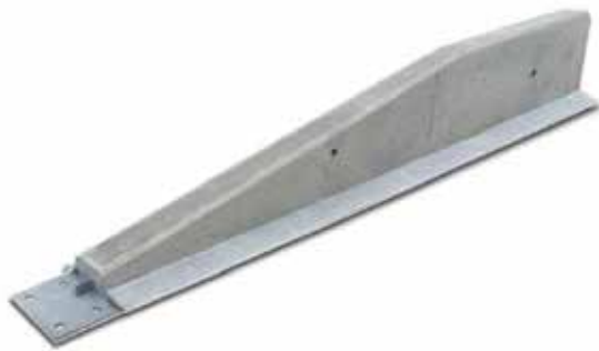
Slutelement med förankringsplatta

DB 65S slutelement måste i enlighet med plannummer V8273.1 och V9080.1 förankras i underlaget med fyra fästankare av storlek minst 24 x 280 mm.