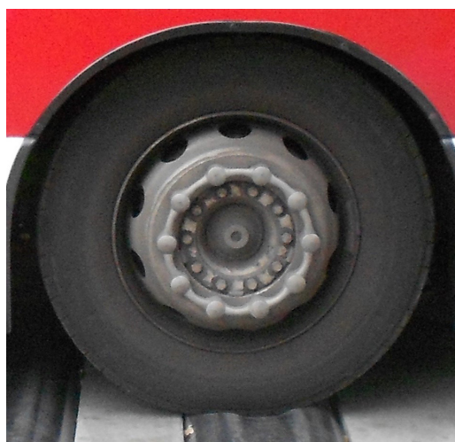
Buss: IFD trycks ned och bussen guppar inte.