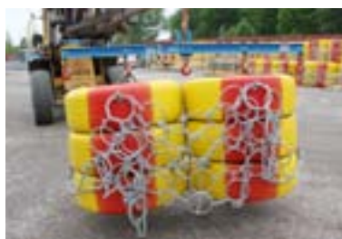
Lyftok måste användas vid transporter.