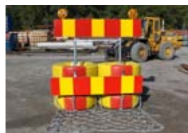
Trafikbuffert 80 med matta.

Stativet ses som alternativ skyltbärare. Vid krocktestet användas A20 normalstorlek samt X2-skärm 2000x400 mm. Så skyltar i liknande storlek men med annat budskap kan användas.